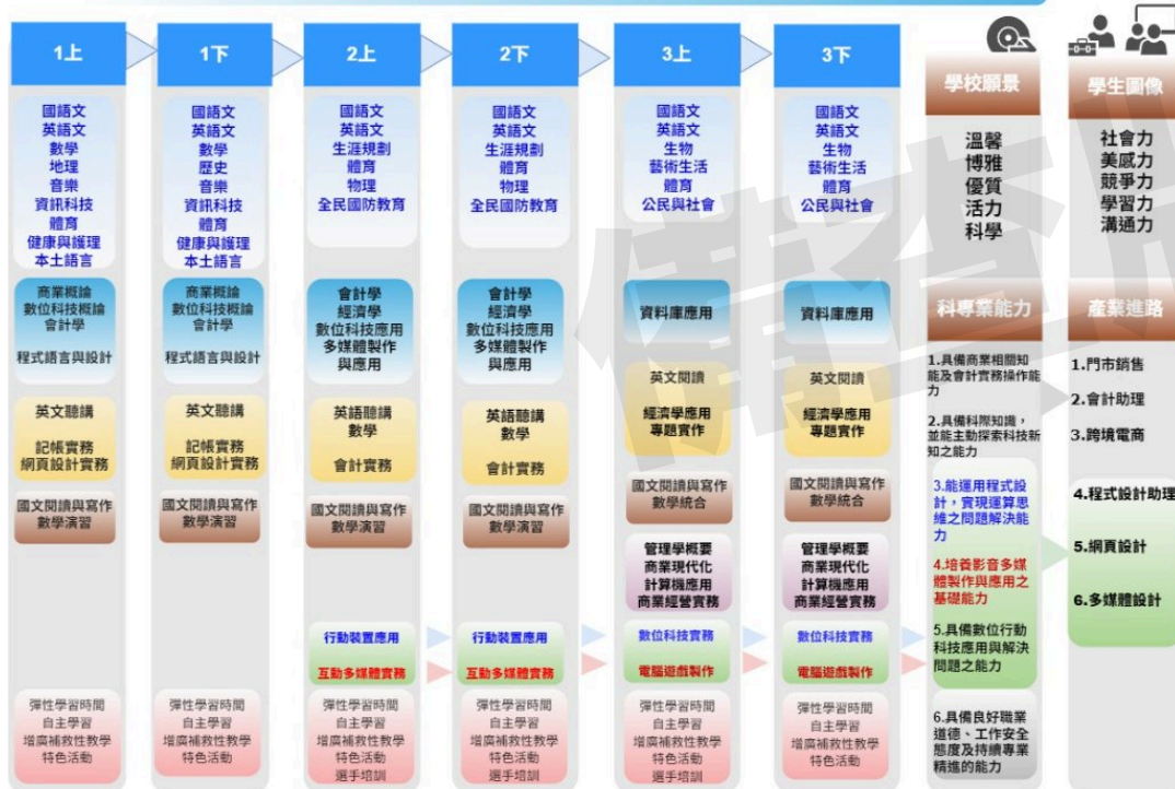
(七) 室內空間設計科(&3660)