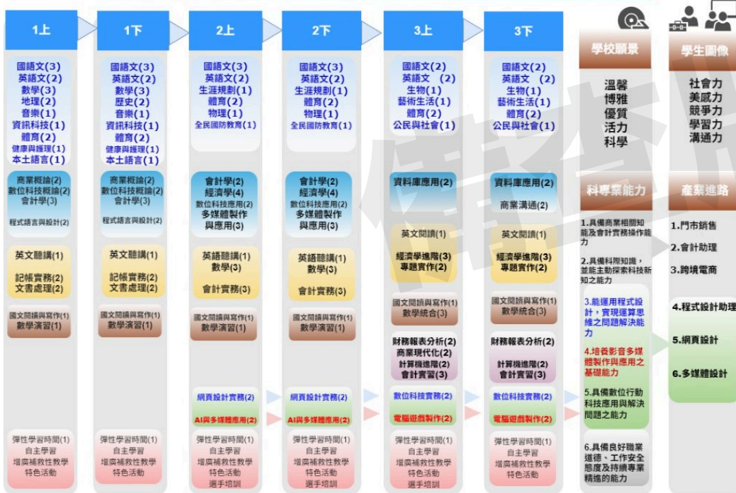
(七) 室內空間設計科(&3660)